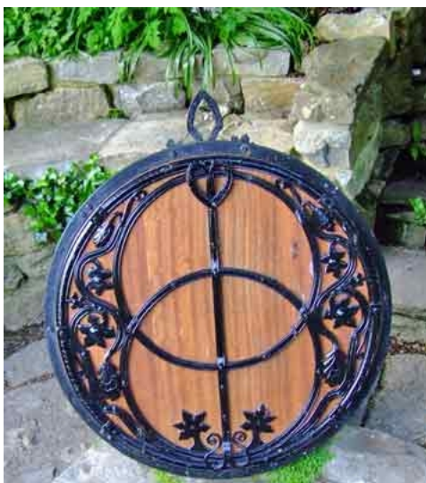
Het symbool van Maria Magdalena in de Chalice Well Gardens (Glastonbury).

oPriorij van Sion beschermd diende te worden.