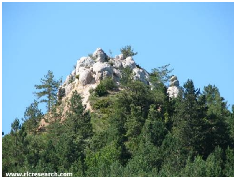
La Pique. De Troon van Isis.

En ik kende alleen de moeder van Lazarus als mijn moeder en de zoete tijd in de gemeenschap van de Essenen toen ik met mijn vriend speelde. Wat hadden we samen een heerlijke kindertijd en welke liefde deelden we met elkaar als kinderen! En toen op de leeftijd van zes jaar riep Moeder Maria mij naar de tuin toe: 'Leg je hoofd op mijn schoot, lief kind.' En zij streek door mijn lange, donkere haren. Zij zei: 'Jij bent uit het licht geboren om de bruid van mijn zoon te zijn. En nu zal ik toezien op jouw training en jou voorbereiden op het heilige huwelijk. Vanaf die dag veranderde mijn leven. Ik was een discipel. Ik werd met discipline behandeld. Mij werden initiaties gegeven. Ik werd voorbereid en meegenomen naar Frankrijk. Ik werd meegenomen naar Egypte. Ik werd voorbereid in inwijdingen door de meesters en mij werd het Egyptische Dodenboek getoond. En ergens in mijn geheugen maakte dat de herinneringen wakker aan de inwijdingen van Isis. Maar pas bij de abdij in Frankrijk had ik de sluier voltooid, toen ik de Illuminatie ontving en mij ieder leven, ieder leven, ieder leven op aarde herinnerde, op deze planeet waar ik van het zout van deze Aarde werd. En ik herinnerde mij het Licht waar ik vandaan kwam. Dit is de Illuminatie. Mijn ziel is het Stralende Licht van Onbevleete Creatie.